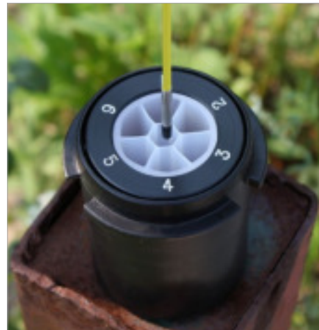
Mediciones hechas a través de los canales angostos del sistema Multicanal CMT de Solinst.

El medidor Mini se ofrece en longitud única de 25 m o 80 pies Se puede suministrar con las sondas P4 o P10.