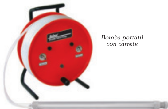
Bomba portátil con carrete

Para realizar muestreos de menor frecuencia, ofrecemos sistemas portátiles con carrete para permitir el acceso a múltiples pozos de monitoreo, aún en sitios remotos. El carrete tiene manija y se sostiene por sí mismo. El sistema se puede suministrar para casi cualquier aplicación independientemente del tamaño o profundidad de la misma.