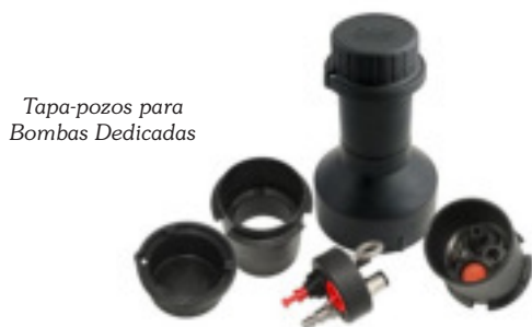
Tapa-pozos para Bombas Dedicadas

La Bomba es ideal para aplicaciones de muestreo de flujo lento y muestreo de flujo normal. La bomba de acero inoxidable puede operar a profundidades hasta de 150 metros (500 pies).